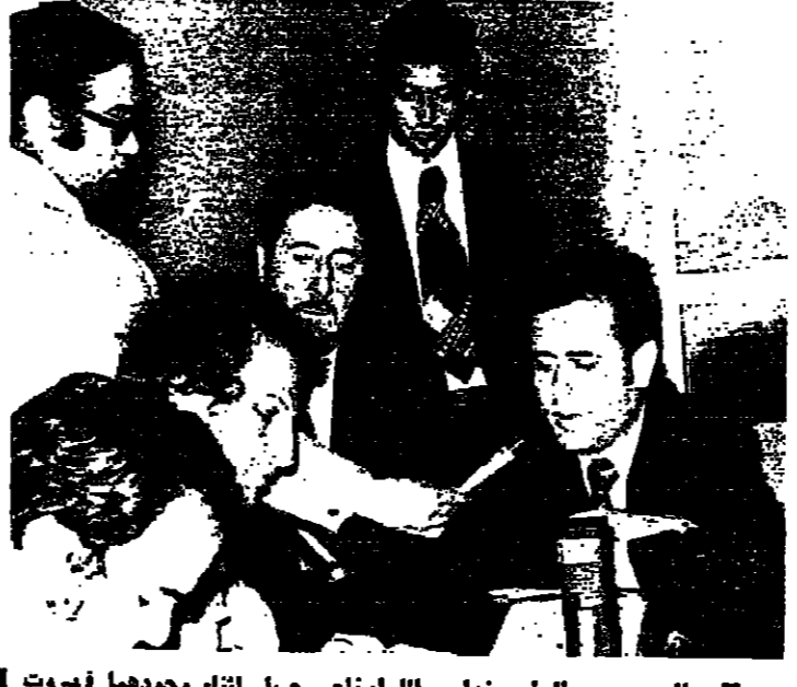
السيد عبد العظيم خدام واللواء ناجي جميل أثناء وجودهما في بيروت

استقبل الرئيس حافظ الأسد مساء أمس السيد عبد العظيم خدام وزير الخارجية السورية، واللواء ناجي جميل نائب وزير الدفاع وقائد القوة الجوية والدفاع الجوي ببنجاب مونتيا من لبنان بعد أن قاما بالمهمة التي كُلِّمَ بها الرئيس الأسد. وقدم السيد خدام واللواء جميل خلال المقابلة تقريرا إلى الرئيس الأسد عن نتائج مهمتهما. وقالت وكالة الأنباء العربية السورية « (سنا) أن الرئيس الأسد أعرب عن رضاه عن نتائج المهمة التي كلف بها خدام وجميل. الرئيس الأسد كل فر لشعب لبنان الشقيق وللشعب الفلسطيني العودة إلى ديارهم. وكان السيد عبد العظيم خدام واللواء ناجي جميل قد عادوا إلى دمشق أمس، بعدما اشتركا في المساعي الهادفة إلى إعادة الوضع في لبنان إلى طبيعته. وقد ألقا الرئيس خراجية رسالة